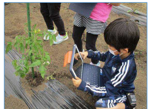
植物の成長の様子をタブレット端末に保存して、記録を残しています。

厚沢部小学校では、学校が一体となって1人1台端末を活用した学習の充実に取り組んでいます。児童全員が双方向のオンライン学習をいつでも行うことができるようTeamsの使い方を朝の会で学んだり、全ての学年の教科等の学習で1人1台端末を積極的に活用したりするなど、学校全体でICT活用に取り組んでいます。