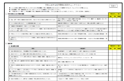
(※画像をクリックすると資料が開きます)

各学校や市町村教育委員会等において、円滑な1人1台端末等の活用に向けた計画を立てたり、取り組む内容を決定したりする際の参考として御活用ください。